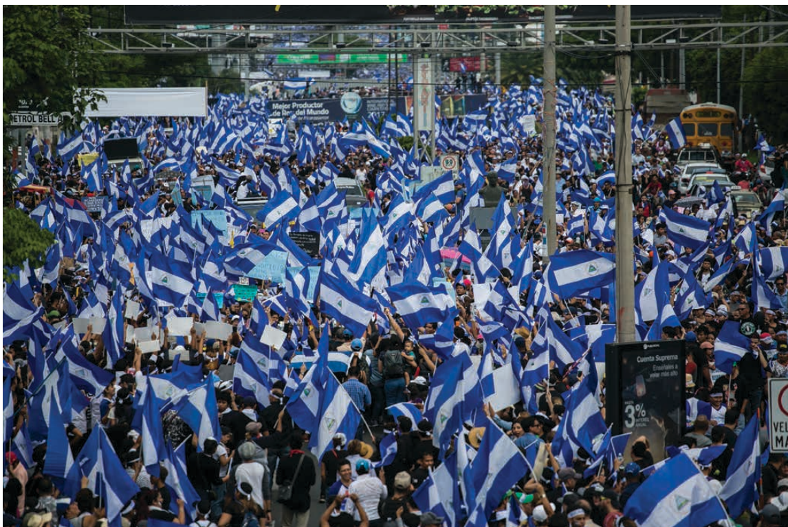
Marcha azul y blanco, en el contexto de abril de 2018

CONFIDENCIAL. 2019, 2 de marzo. "Elecciones regionales: Entre la desconfianza y el abstencionismo". https://confidencial.com.ni/elecciones-regionales-entre-la-desconfianza-y-el-abstencionismo/ .