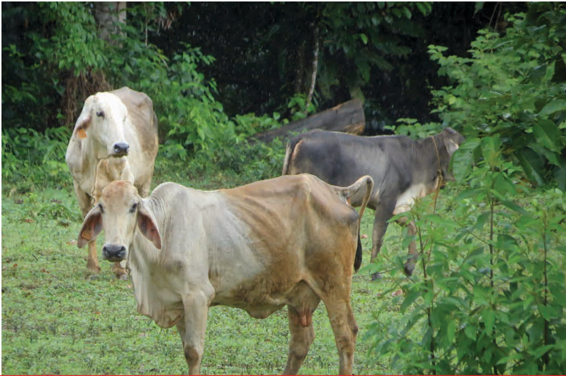
Marcha anticanal en Ometepe, Rivas